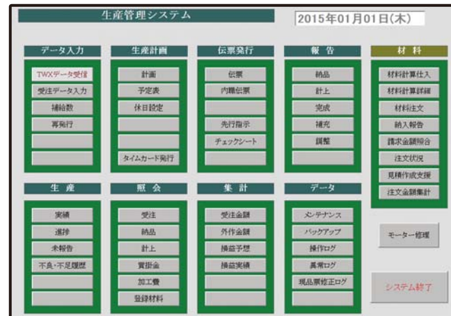
操作画面イメージ